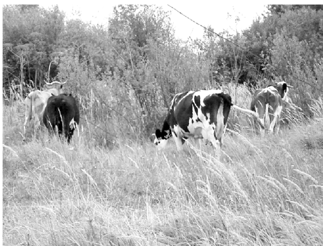
Главное богатство фермеров.

Обратил внимание на ряд техники, стоящей на площадке у мехмастерских. Фермерский машинно-тракторный парк не мал: 7 тракторов, автомашина ГАЗ-53, два зерноуборочных комбайна “Енисей”, кормоуборочный комбайн