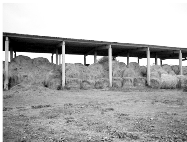
Запас кормов надежный.