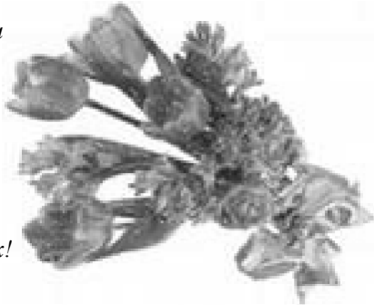
Дети, внуки, правнуки.

Живи ты долго, пожиная Душевной щедрости плоды!